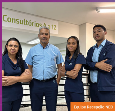
Equipe Recepção NEO

O NEO é o resultado dos esforços empreendidos pela Diretoria Executiva para oferecer ao paciente o suporte tão importante e necessário em todas as fases do tratamento.