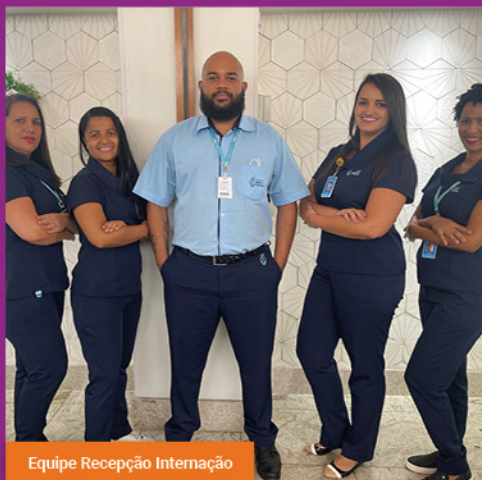
Equipe Recepção Internação